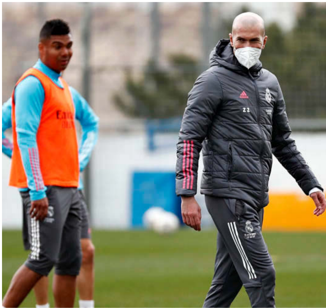
Casemiro y Zidane, en un entrenamiento.